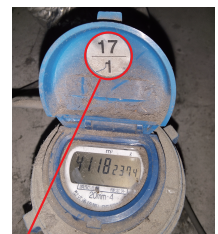
有効期限がこちらに表示されています。 ※この写真は一例です。

この報道を受け弊社では、市町村が検針を行っていない物件に対して、一斉に現地確認を行うことになりました。後日対象となる物件のオーナー様には、状況のご案内と交換のお見積りをOS課担当者からお知らせいたします。よろしくお願いいたします。