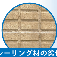
シーリング材の劣化